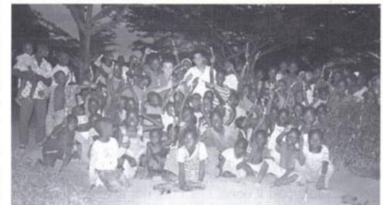
Regal als nens d'un raspall per a les dents.

—Ens plantejem acabar les coses que no es varen poder acabar de materialitzar i, evidentment, créixer i tirar endavant nous projectes que, de fet, ja tenim sobre la taula.