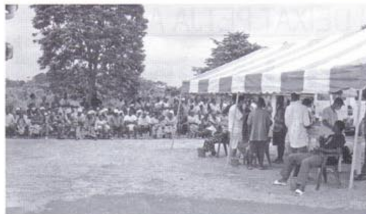
La paradeta ambulante

hi ha un abisme entre els dos mons però viuen a la seva manera, amb els seus costums, conformant-se amb allò que tenen i, evidentment, quan algú els ofereix ajuda l'agafen i es deixen ajudar. Si una cosa em va impactar va ser el tema del tractament que tenen de la mort. Quan vàrem arribar, un noi que feia dies que feia de metge i que era allà amb una altra ONG no va poder salvar una mare i el seu nadó a l'hora de donar a llum. L'estat de desànim i dol dels seus familiars va durar sorprenentment molt poc. I no perquè fossin gent sense sentiments, ni una mala família, sinó que estan tan acostumats a conèixer amb la mort que per a ells és un fet associat que s'assimila com a tal.