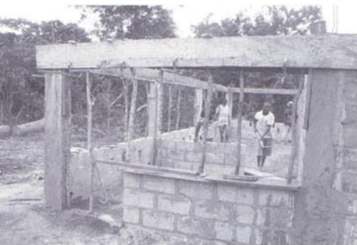
Construcció del menjador escolar