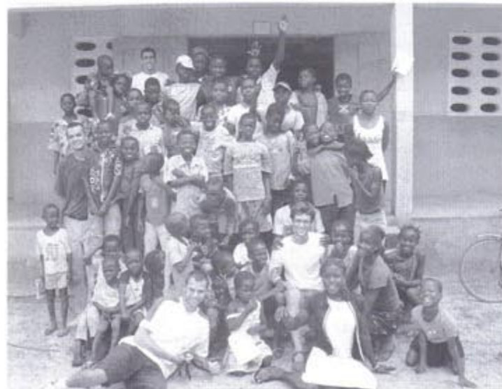
Foto de grup a la porta de l'escola

—Deixant de banda el suport mèdic amb què vam comptar, els projectes els vàrem valorar de manera molt positiva i amb la sensació que has fet alguna cosa que pot haver ajudat a un grup de gent important. L'abastament d'aigua és un projecte que encara hem d'acabar, però que és a punt de dur-se a terme. En canvi, la construcció del menjador de l'escola va ser una realitat de la qual nosaltres també vàrem poder gaudir fent de paletes i de manobres, i acabant l'obra en el temps que nosaltres vam ésser allà. Som conscients que han estat petits projectes d'iniciació, però que alhora ens serviran, d'una banda, de targeta de presentació a l'hora de buscar noves subvencions o patrocinadors, que veuran de primera mà on van destinats els diners que ens donen, i de l'altra són el gra de sorra perquè la nostra ONG pugui començar a créixer. Concretament, a quin punt d'Àfrica vàreu fer aquests projectes? —En un lloc que ni gairebé surt als mapes (rialles), Manaboué, a la